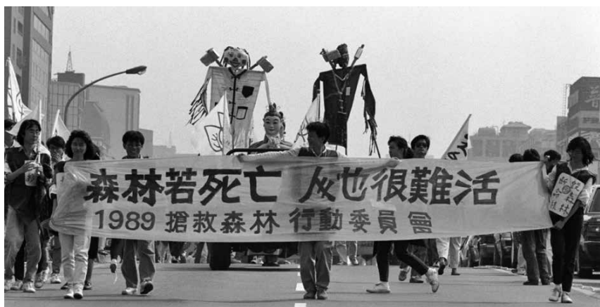
圖 32、1989 搶救森林行動委員會隊伍高舉「森林若死亡 人也很難活」布條（1989.03）