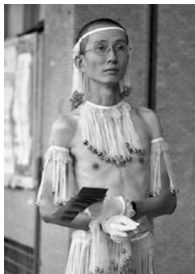
圖9、祁家威「東方不敗」保險套裝扮（1992年5月）

有想法、有意識的去現場，就能拍到東西，很多專題是我主動提議要去做。我有紀錄祁家威，他很不簡單。他是「知名同性戀者」、「全臺第一個出櫃男同志」、「資深愛滋志工」及「資深同運人士」，多年來的同志大遊行，常看到他站在制高點上，孤獨的邁力揮舞彩虹旗的戰士身影，讓我印象深刻。81年（1992）5月，祁家威在「第二屆國際愛滋病學術研討會」期間，以五百多個保險套縫製「東方不敗」裝，在街頭發放保險套紅包，紅包袋正面印「願您快樂，望您健康，魚與熊掌兼得」、反面印「不用沒面子，有用才正點」，上街為愛滋防治宣傳。 47 我也記錄了「殘障福利法」的抗議現場，當初殘障人士在那邊抗議，忽然間一個人拿刀自殺，用死諫抗議。民國79年（1990）1月，立院三讀通過「殘福法」修正案。有人說，張志雄是殘障界的鄭南榕，但是至今仍有許多人不認識他，弱勢者是沒有名字的！ 48