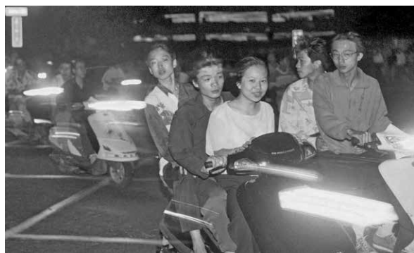
圖 12、三貼共乘

說明：三貼的「規矩」：前面兩位乘客是男女，女朋友不能坐中間要坐前面，因為不能摸到別人的女朋友。