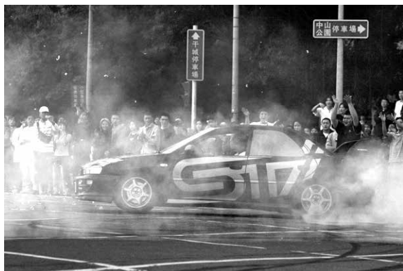
圖 18、當年聞名全臺的飆車手鴻麟（2003 年）