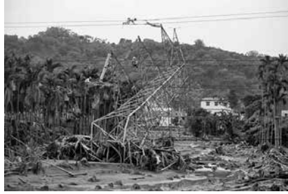
圖 35、倒塌的高壓電塔(2001.07)

開到不能開的時候，就改搭發財車 76 接駁進去。在災區現場就覺得，這是濫伐濫墾的影響，但我沒有證據。還好森林運動讓大家環境的概念有很大的變化，伐木很快就踩煞車，不然會更慘。讓土地休息了30年，經歷這段時間以後，就又變穩定了，信義鄉已少見土石流災難了。