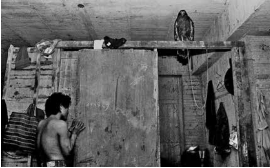
圖 20、養在工地現場的老鷹(1985年5月)