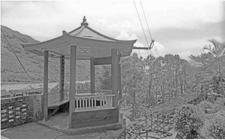
圖 37、改建前的旭東亭