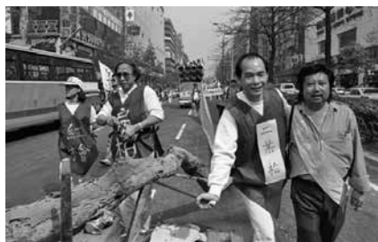
圖 28、帶著二葉松枯木演出街頭行動劇(1989.03)

柏、二葉松等，手還扛著二葉松枯木。不只爸媽參與遊行，孩子也都整車整車的載，小孩身上掛著「救森林 愛臺灣」、「愛國家 救森林」以及鐵杉等樹木的名字。這些車上的小孩子，現在都三、四十歲了。