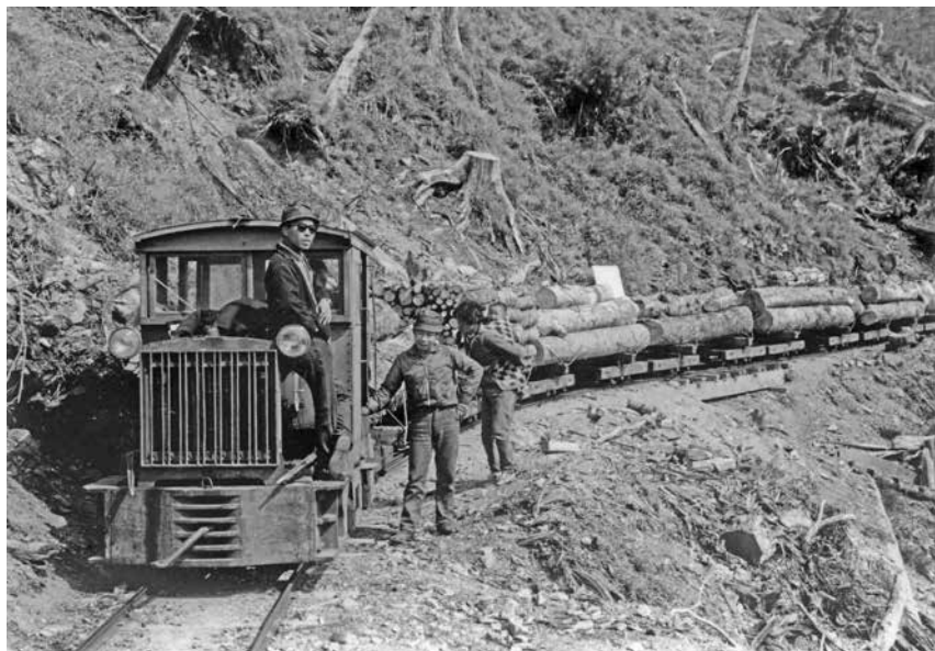
圖 5、林田山鐵道運材火車停靠七星崗站