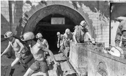
圖 19、完成了礦坑裡辛勞的挖煤工作後，礦工們隨著運煤車，由黑暗的地底登陸地上

的礦災，讓還在籌劃階段的《人間》雜誌，經會議討論後決定要派人去作礦工生活紀錄，然後就由我去記錄礦工的生活，我選擇拍攝「建基煤礦」，礦區現在已經沒有開採。 53 我在民國 73 年 7 月份到瑞芳的建基煤礦的礦工聚落記錄，那邊整個村落幾乎都是阿美族，他們都是爲了賺錢來挖礦。我在拍建基煤礦礦區時，礦工的老婆們在聊天等老公回來，稱讚我是帥哥，要跟我合照。住在礦區的小孩，已經是第三代了，他們在這裡住很久，我們不知道而已。那時候的主流媒體很少會去報這種弱勢的人，因爲這對