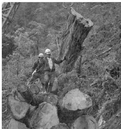
圖 24、伐木運材現場。用集材機將原木堆疊於運材車上。 資料來源：賴春標，〈丹大林區砍伐現場報告〉，《人間》23（1987 年 9 月），頁 30。