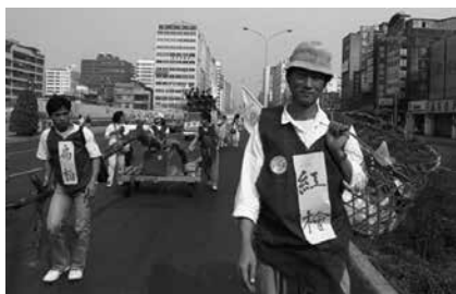
圖 29、1989年3月第二次森林運動遊行(1989.03)