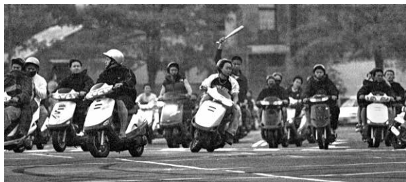
圖 17、前導飆車隊伍（2003 年）