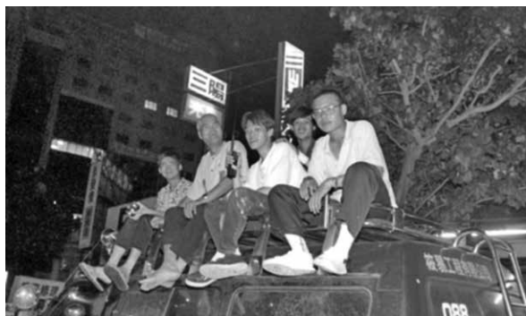
圖 13、開車來看飆車

說明：三貼的「規矩」：前面兩位乘客是男女，女朋友不能坐中間要坐前面，因為不能摸到別人的女朋友。