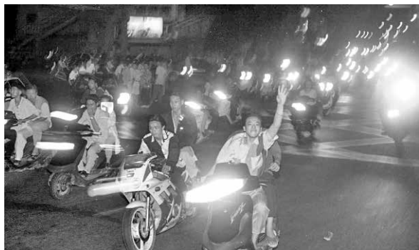
圖 11、那一夜，飆車族佔領了臺中市街道（1995.06）