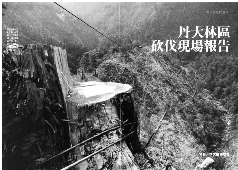
圖 23、丹大林道 80 公里處之第七林班第二伐木現場，由林道開始伐木一直砍到卡社溪底，即濁水溪上游之集水區。圖／文：賴春標。 資料來源：賴春標，〈丹大林區砍伐現場報告〉，《人間》23（1987 年 9 月），頁 26-27。