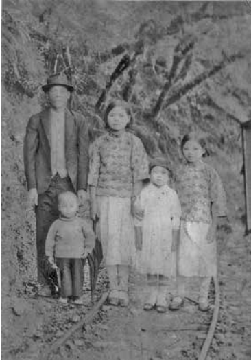
圖 1、日治時期家族於太平山合影