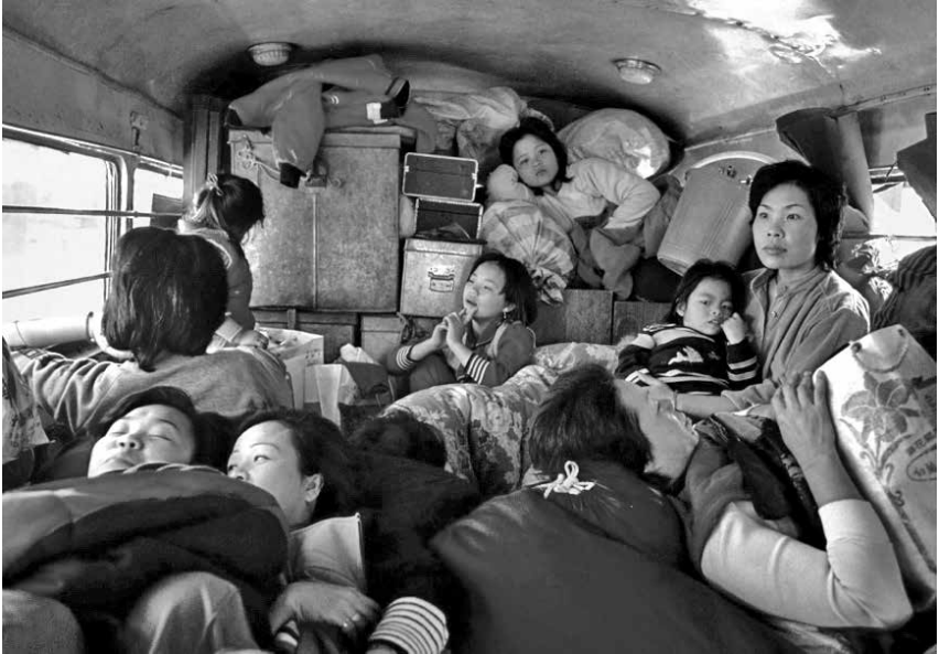
圖 7、1984 年，嘉義，寒冬，從嘉義開往臺中霧峰演出的高速公路上，「安安歌仔戲班」的團員們縮瑟在卡車裡，彼此的體溫溫暖了整個車廂。圖／文：蔡明德。

資料來源：蔡明德，《人間現場：八〇年代紀實攝影》（臺北：南方家園文化，2016），頁 80-81。