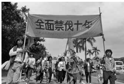
圖 31、遊行隊伍高舉「全面禁伐十年」布條(1989.03)