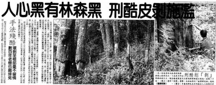
圖 21、「剝」削酷刑：蒼勁的老林木枯黃奄奄一息，它們不是病了，而是被狠心地剝了一層皮。南投仁愛鄉翠巒地區力行產業道路沿線，大片被林務局認為「無經濟價值」的原始林木，慘遭「環剝」命運（左圖），連許多須兩三人合抱的巨木也難逃毒手（右圖）。 資料來源：〈山林輓歌 現場目擊系列之二 官商勾結疑雲 濫施剝皮酷刑 黑森林有黑心人〉，《中國時報》，1996 年 10 月 2 日 2 版。

機，那一趟真的是坐到屁股都痛。摩托車沿著山路一直往上騎，真的就讓我拍到樹木被環狀剝皮的樣子。我拍了很多照片，看到林務局連超大棵的雜木，也把它剝死，連我都看不下去，而且原來的樹木還沒死，就把新的造林樹肖楠種下去，樹苗怎麼會活？長不大啊。