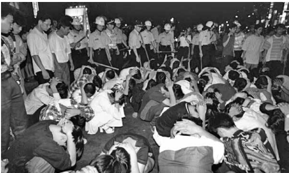
圖 16、年輕便衣員警混入車隊(身上貼黃貼紙)參與圍捕