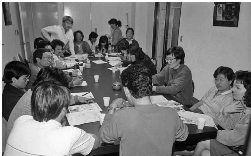
圖 33、第一次森林遊行前於《人間》雜誌社召開籌備會議（1988.03）