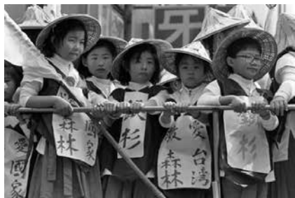
圖 30、兒童掛上牌子代表森林幼苗(1989.03)