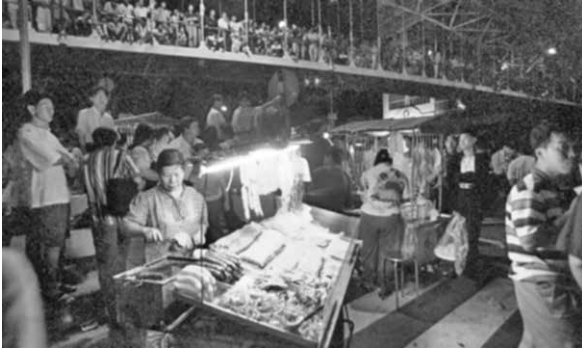
圖 14、飆車現場香腸攤