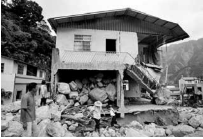
圖 34、桃芝颱風後的信義鄉民宅 (2001.07)