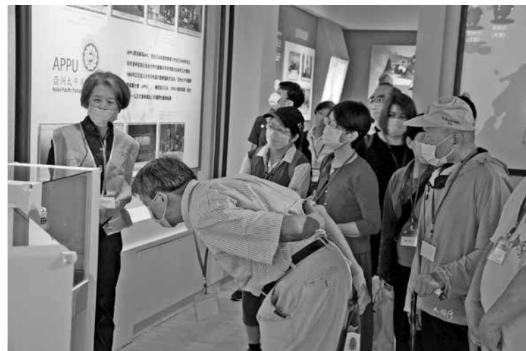
圖 8：參訪立法院議政博物館本館 2