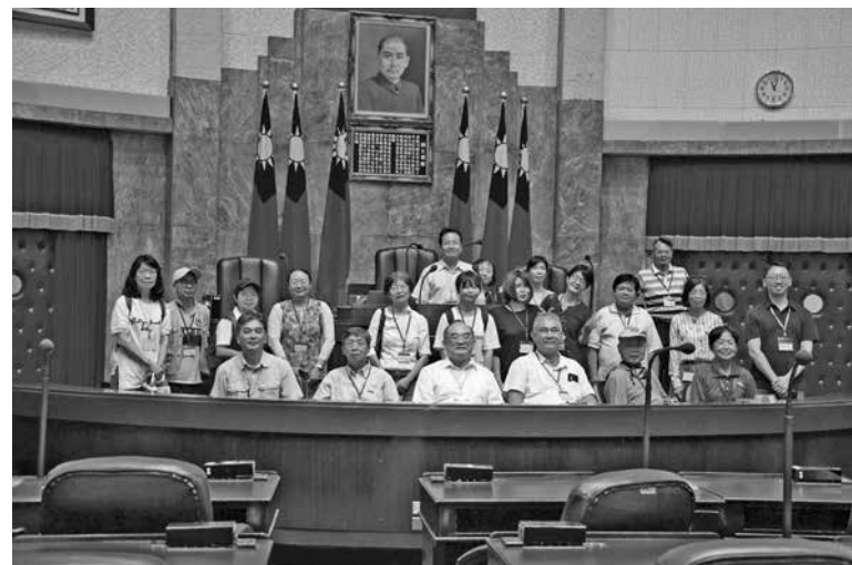
圖 12：議事堂內大合照