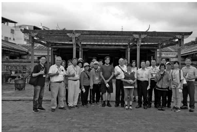
圖 17：景薰樓內廣場大合照