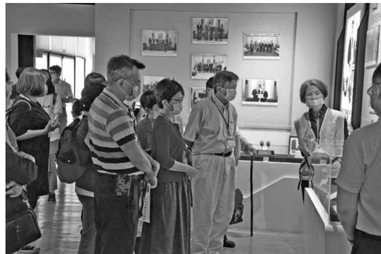
圖 7：參訪立法院議政博物館本館 1