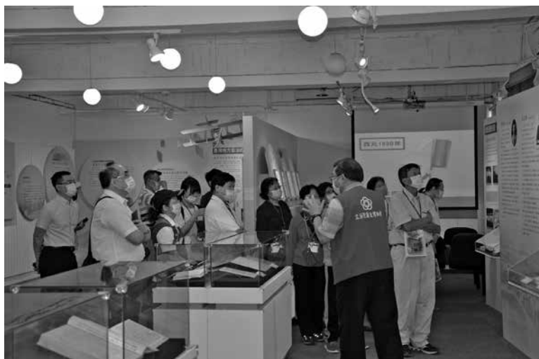
圖 13：參訪立法院議政博物館第 2 展館