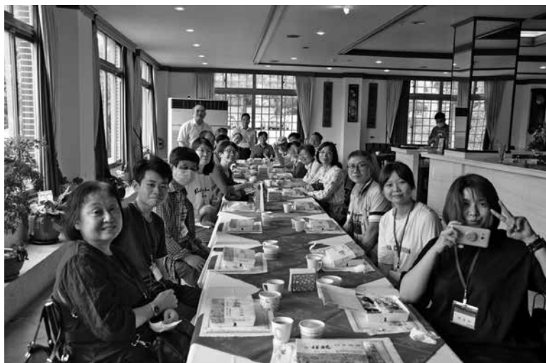
圖 14：明台高中餐旅會館用餐合影