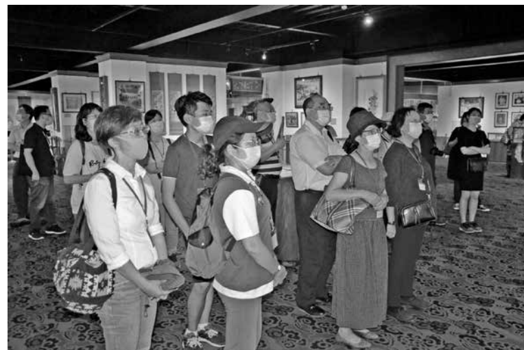
圖 16：參訪林獻堂博物館 2