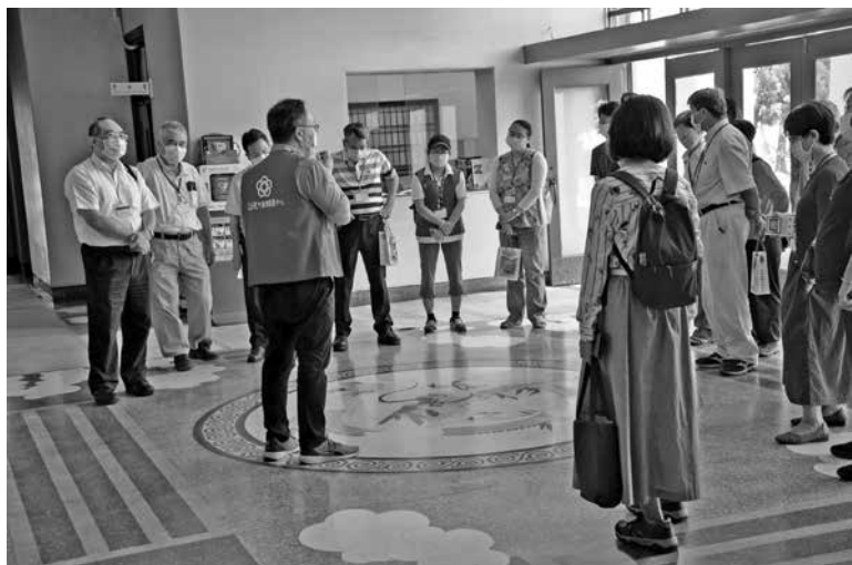
圖 10：導覽議事堂龍紋圖騰