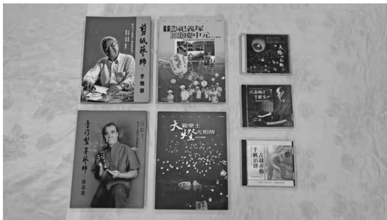
擔任口述歷史業務承辦人兩年間的出版品，總計專書 4 本、DVD 3 片

筆者於 2015 年因生涯規劃考量離職。離職後，秉持「不在其位、不謀其政」的行政倫理，除非後任承辦人主動聯繫、詢