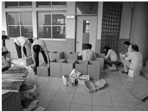
2014 年 4 月，動員志工、替代役整理某倉庫，將口述歷史等文化資產專書整理、裝箱

2014 年初，其中一處倉庫表示不願再出借、另一處倉庫表示要整修、第三處庫存地點表示「只出不進」，多年來歷經數位文資料承辦人積累，總計數千餘片、本的口述歷史出版品如何處置？頓時成爲一大課題！所幸歷經 1 年的時間，由主管、資深同