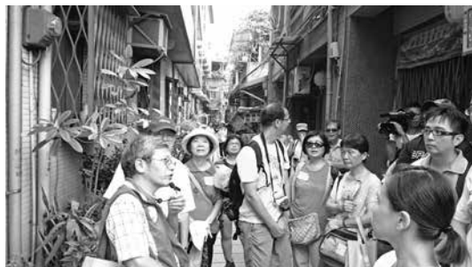
2014 年 8 月，協助口述歷史 DVD 廠商（右持攝影機者）取得新莊老街導覽鏡頭

此外，承辦人也會就能力所及，在契約書規範內容中協助廠商，減少執行過程的不順利。例如 2014 年筆者亦為志工業務承辦人，當年舉辦文化導覽活動，其中就包括新莊老街的導覽，筆者恰巧審閱 DVD 廠商的腳本大綱，廠商需要「導覽活動」的鏡頭，於是筆者轉告新莊老街 DVD 廠商某日有志工導覽新莊老