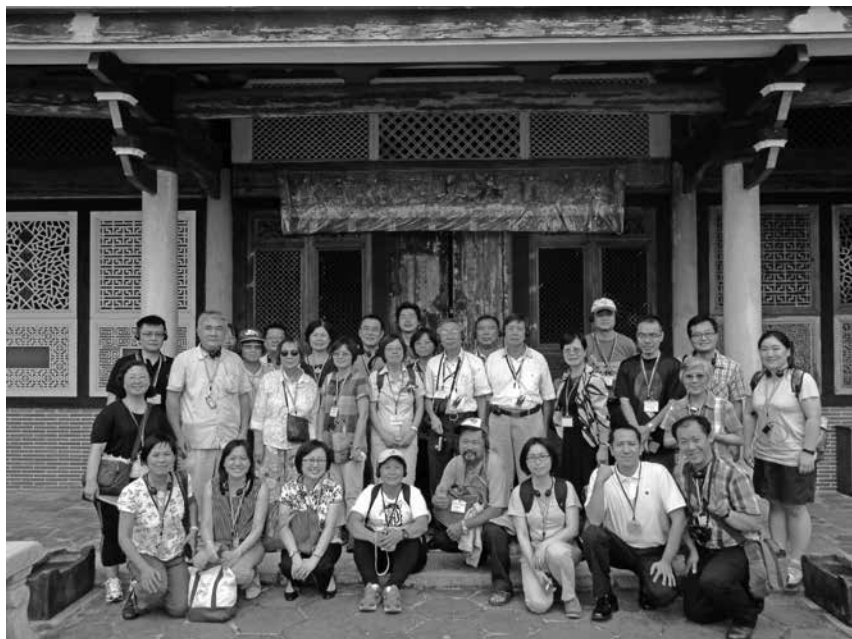
2015年8月22日，臺灣口述歷史學會第四屆第一次會員大會於臺中舉辦，會後參訪霧峰林宅（筆者為前排右一蹲者）