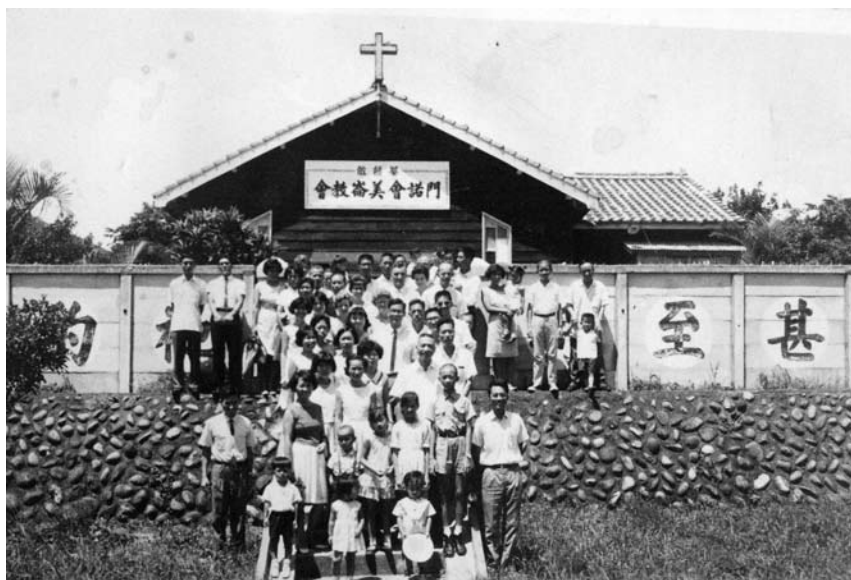
門諾會美崙教會的舊禮拜堂